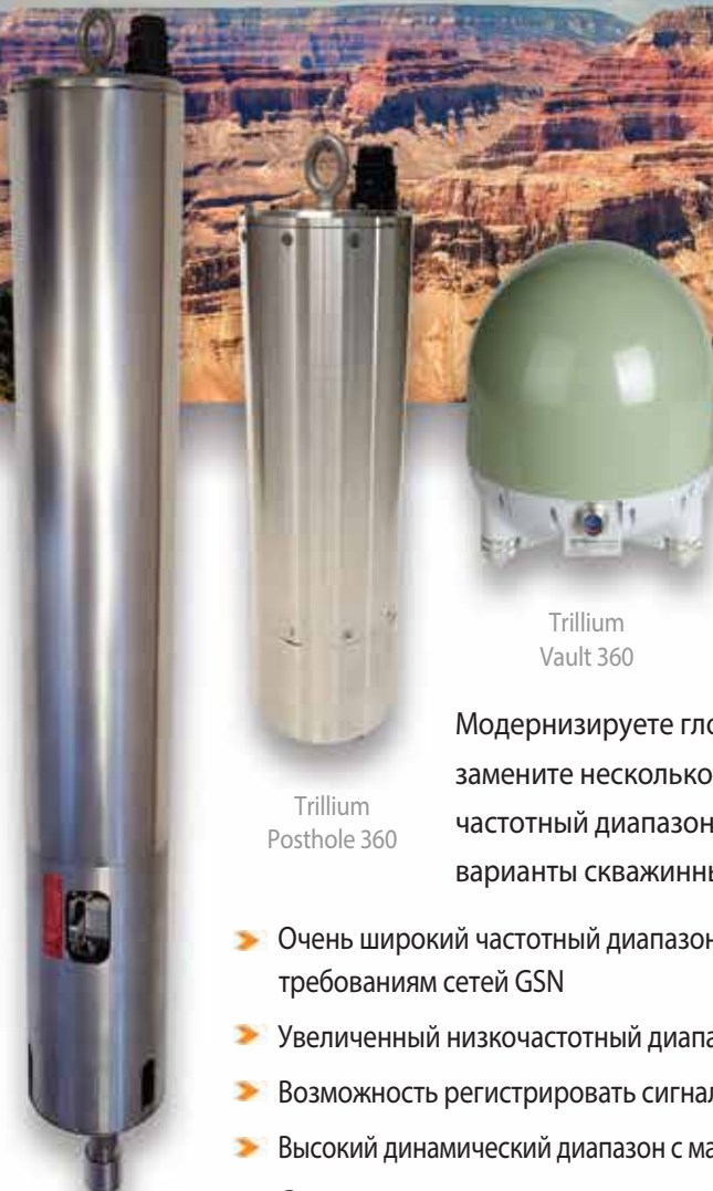
Trillium Vault 360